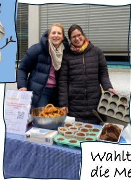
Wahltag-Spenden-Aktion für die Medienbildung (2025)