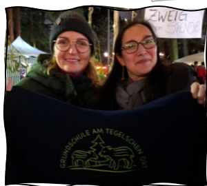
Dream Team Schulkleidung – ab jetzt gibts auch Hoodies!

Ob GEV, EV, Klasseninitiativen, BEA, Fach- oder Schulkonferenzen: Die Eltern gestalten das Schulleben aktiv mit.