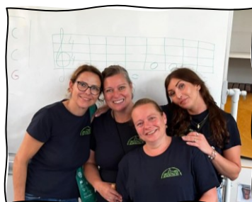
Festeteam(s), das Herz unserer Events