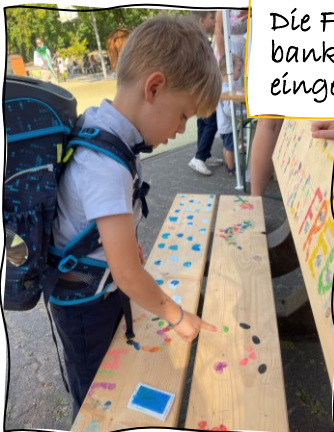
Die Freundschaftsbank wird 2024 eingeweiht