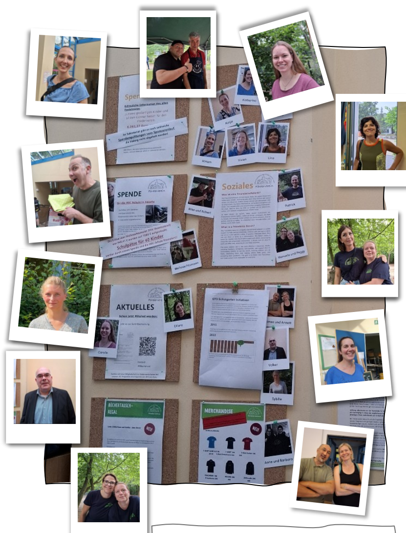
Unsere Pinnwand im Südflügel

Ermöglicht wird all das durch die großzügigen Beiträge unserer Mitglieder – Eltern, Verwandte und ehemalige SchülerInnen – sowie durch ein starkes Netzwerk aus lokalen Organisationen, Behörden, der Kirchengemeinde, Konradshöher Geschäften und engagierten Privatpersonen, die Zeit, Sachspenden oder finanzielle Mittel einbringen.