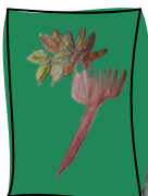
Ernte im Schulgarten

Im September steht das neue AG-Programm zur Buchung bereit: Team work makes the dream work!