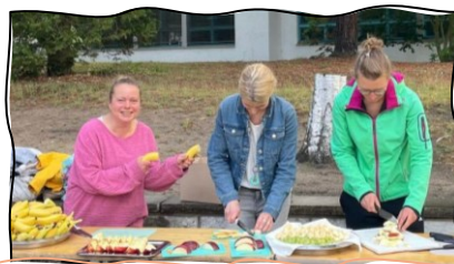
Obststand - ein Klassiker bei den Bundesjugendspielen